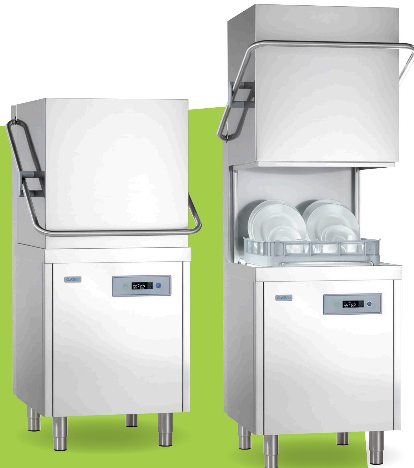
P500RBP mit Drucksteigerungspumpe